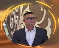
PAK SUPRAT PBB